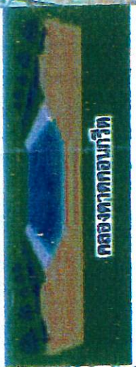
คลองทากอกบึงกุด

3. คลองชุดใหม่ ความยาว 3.00 กม. และปรับปรุงคลอง D1 ยาว 10.80 กม. ระบายน้ำ 550 ลบ.ม./วินาที (เดิม 50 ลบ.ม./วินาที)